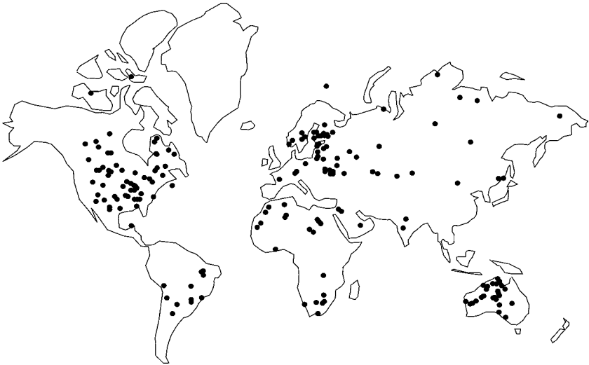
Joonis 6. Meteoriidikraatrite globaalne jaotus.

võrreldes pooluste ümbrusega soodustab ka meteoorkeha atmosfääris viibimise aeg, mis ekliptikatasapinnalt saabuva meteoori puhul on ekvaatoril lühem kui pooluste läheduses. Meenutagem, et mida lühem on teekond läbi atmosfääri, seda suurem on võimalus, et meteoorkeha jõuab maapinnale kraatrit tekitama.